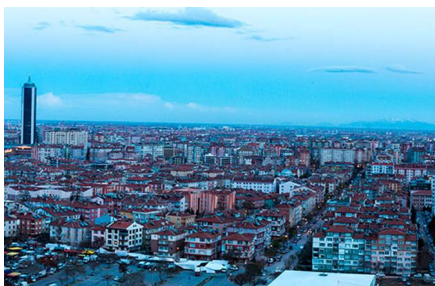
Konya/Provincia di Konya